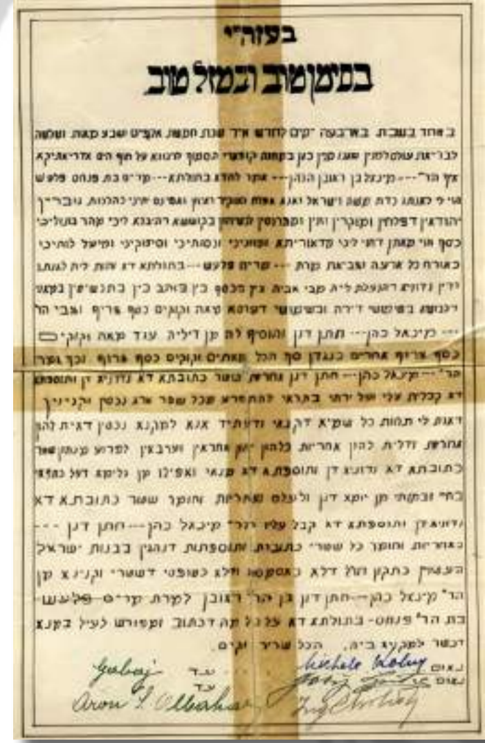
Ketuba (Židovski bračni ugovor)