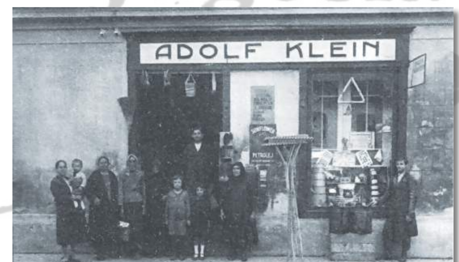
Obitelj Klein pred svojom trgovinom