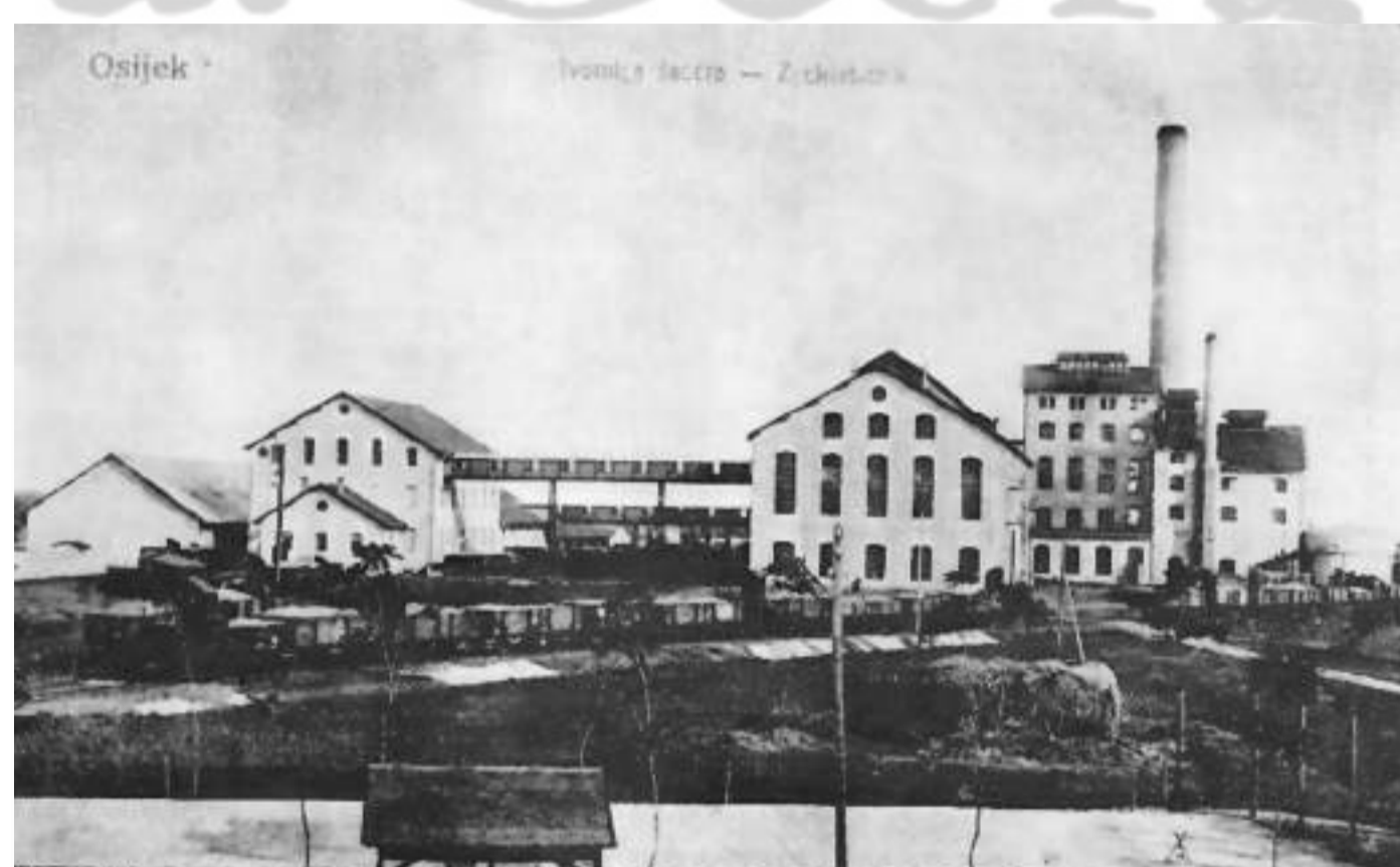
Tvornica šećera u Osijeku