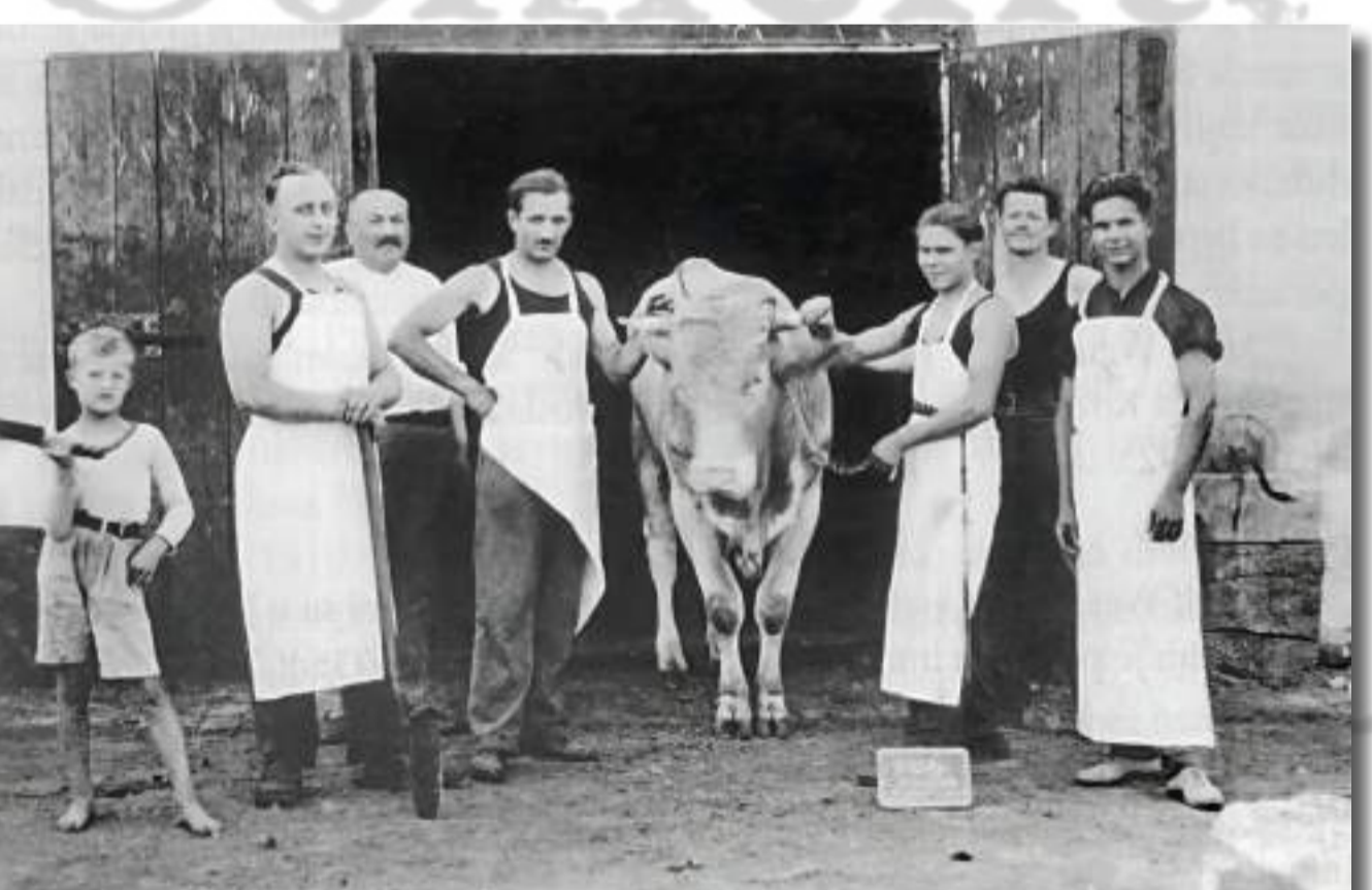
Mesarski obrt Mavre Wienera