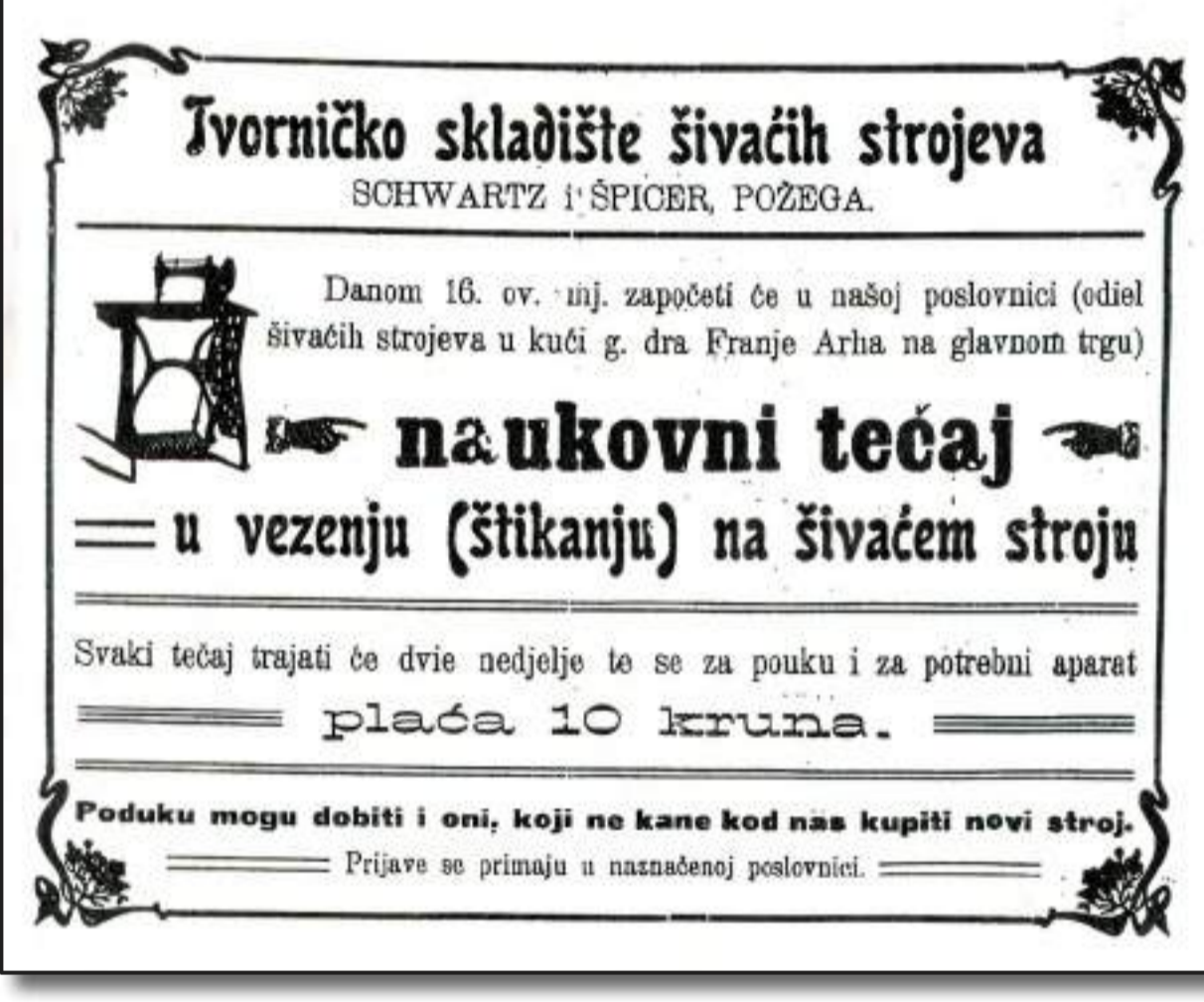
Poslovnica šivaćih strojeva u Požegi