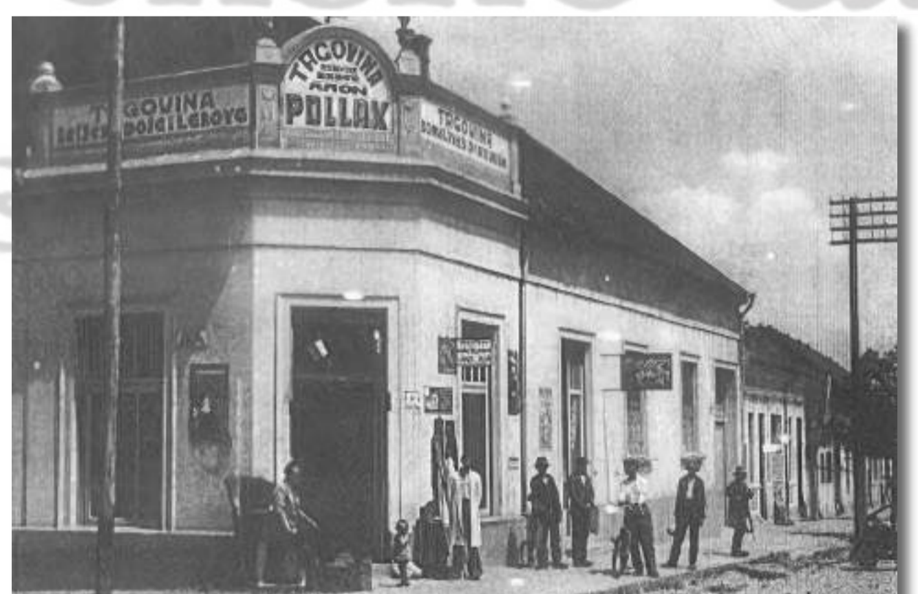
Trgovina boja i lakova u Našičama