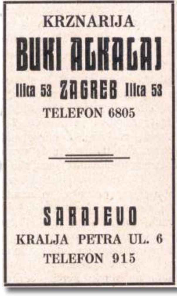
Krznarija u Zagrebu