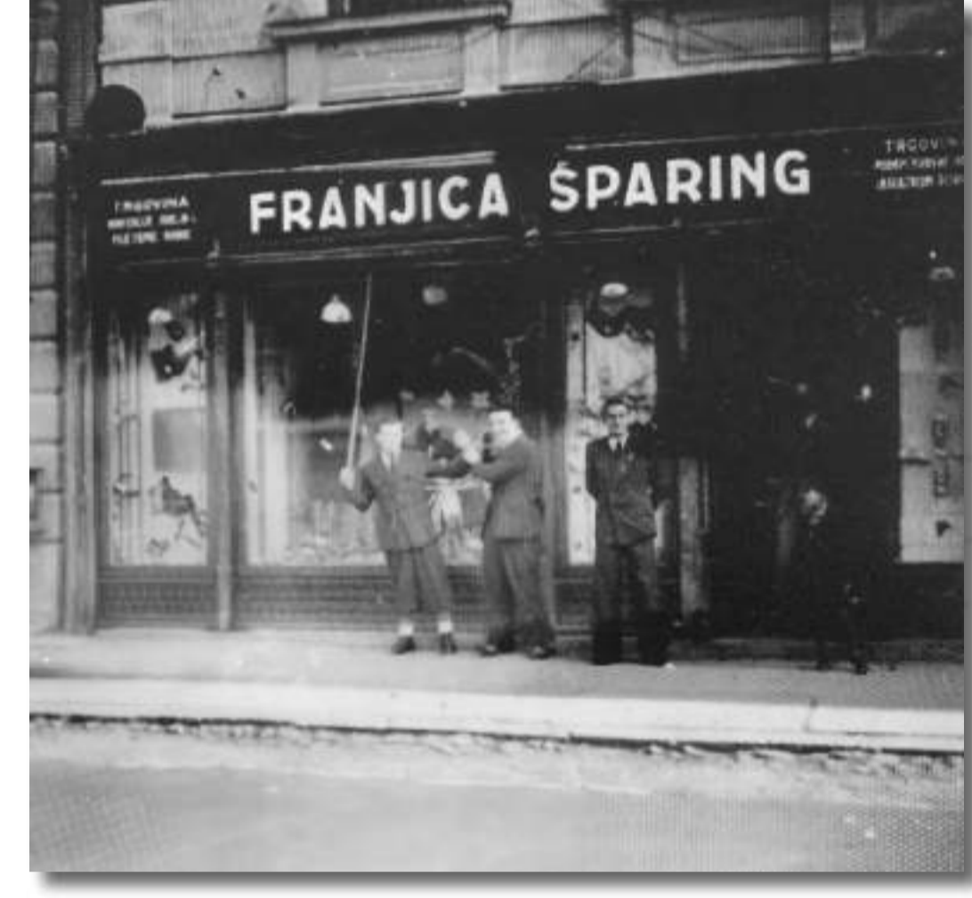
Trgovina mješovitom robom u Varaždinu